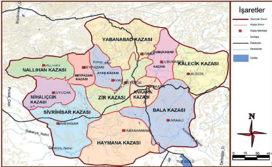
Şekil 3. 19. Yüzyıl Haymana Kazasının İdari Durumu

Sultan Abdülmecit zamanında çıkarılan Arazi Kanunnamesi (1858) ile devlet arazileri üzerinde özel mülkiyete izin verilmesi, tarım için kullanılan toprakların tasarruf edenin mülkiyetine geçmesi, konar-göçer aşiretlerin yerleşik hayata geçmesini kolaylaştırmış ve bu dönemde birçok konar-göçer aşiret Haymana'da eski yerleşimcilerin terk ettiği harap olmuş köylerin üzerine yerleşerek yeni köyler kurmuşlardır (Yurttaş, 2018). Haymana, 1882 yılında II. Abdülhamid zamanında idari bir merkez haline getirilmiştir. Haymana'nın günümüz idari merkezi olan mevkiinin belirlenip imar ve iskana açılması (hükümet konağı, okul, cami, sağlık çalışanları, telgraf hattının çekilmesi ile posta ağının kurulması, beledi teşkilatı) Kırım ve Kafkaslardaki gelişmeler sonrasında Anadolu'ya göç eden Müslüman muhacirlerin Haymana'daki boş uygun tarım arazilerine yerleştirilerek buraları yurt edinmeleri ve tarımsal faaliyetlere başlamalarıyla birlikte 1860-1910 yılları arasında olmuştur (Çevik Azap, 2018). XIX. yüzyılda Haymana kazası, doğudan Bâla, batıdan Sivrihisar, kuzeyden Zir ve güneyden Konya vilayetine bağlı olan Akşehir kazası ile çevrelenmekteydi (Şekil 3).