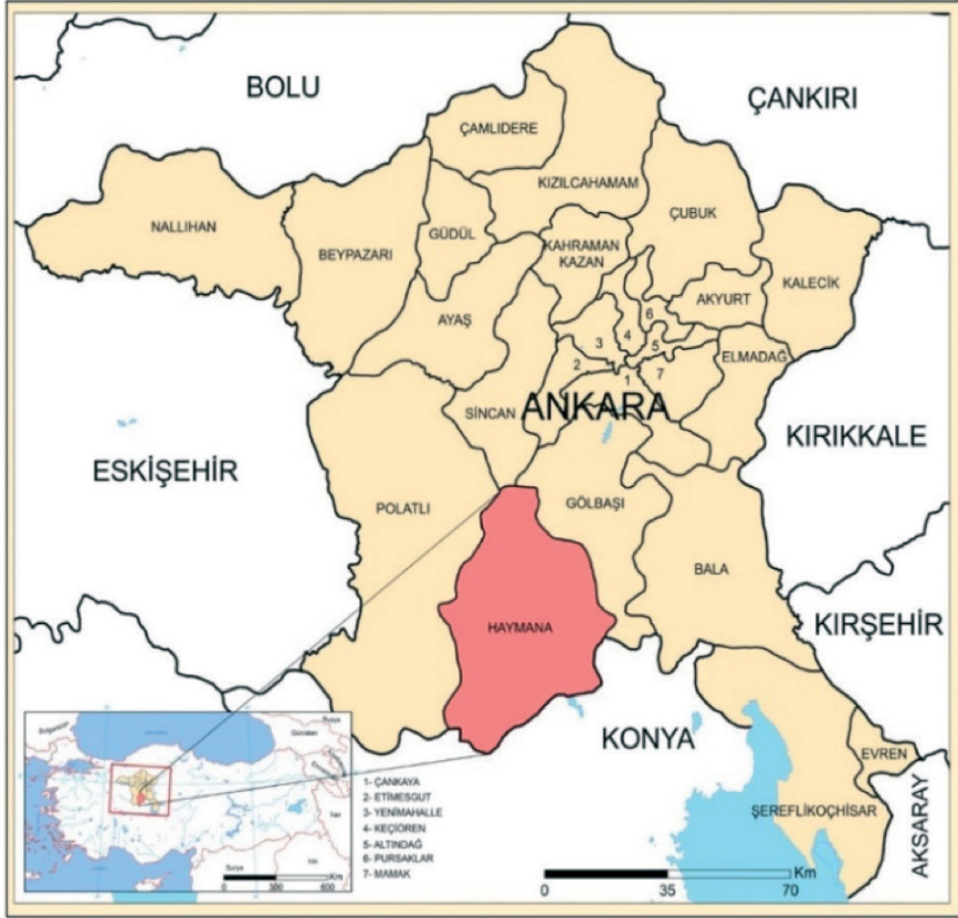
Şekil 2. Haymana İlçesinin Lokasyon Haritası

Osmanlı Devleti'nin yükselme devrinde (XVI. yüzyıl) Ankara sancağı merkez kazanın dışında Ayaş, Bacı, Çubuk, Murtazaâbâd ve Yabanabâd (Kızılcahamam) olmak üzere toplam beş kazadan oluşmaktaydı. Bu dönemde Haymana, Ankara'nın güney kesiminde konar-göçer yurdu olarak bilinmektedir. Sancağının önemli iskân sahalarından olan bu bölgede Ankara yürükleri arasında gerek nüfus gerekse cemaat sayısı bakımından en kalabalık konar-göçer teşekkülü olan Haymana taifeleri yaşamaktaydı (Tablo 1). Haymana taifesi genel olarak Haymana platosunun kıyı kesimleri boyunca dağılmış vaziyette idi (Turan, 1999; Erdoğan, 2004).