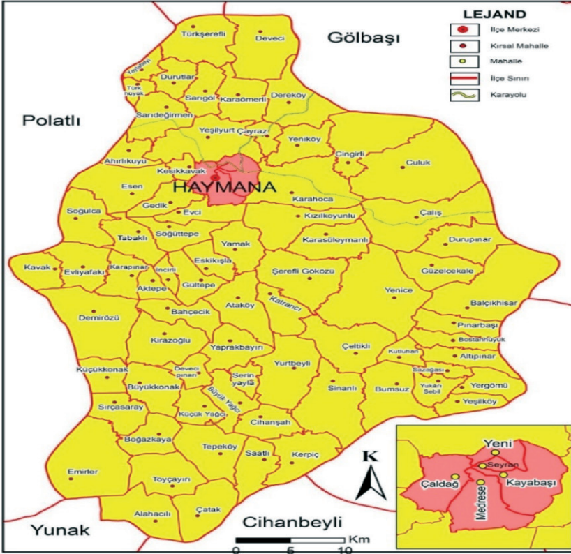
Şekil 4. Haymana Büyükşehir İlçesi Kırsal ve Kentsel Mahalleleri

Haymana ilçesinde 7254 Sayılı Kanun ile bu statüye kavuşan 73 kırsal mahalle mevcut olup, 2022 yılı itibariyle bu mahallelerin toplam nüfusu 18.404 kişidir (Şekil 4).